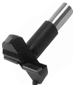
(Broca tipo dobradiça de copo)